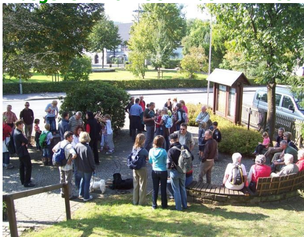
Wanderer Treffpunkt SGV Platz Amecke