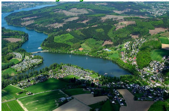
Wandergebiet Amecke am Sorpesee