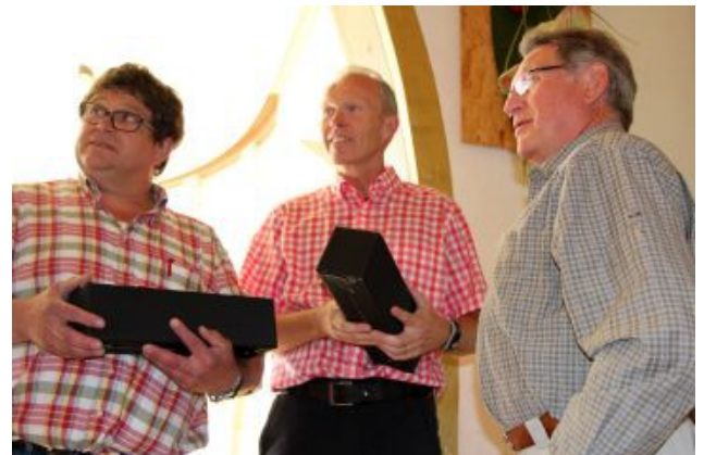
Gestaltung/Fotos/Text: Michael Penzel, SGV DO-Aplerbeck