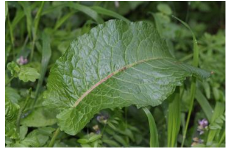
Blatt von Stumpfbliättriger Ampfer