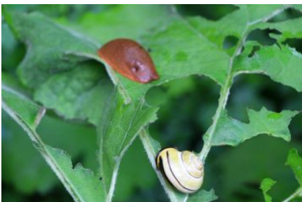
Rote Wegschnecke u. Hain- Schnierkelschnecke