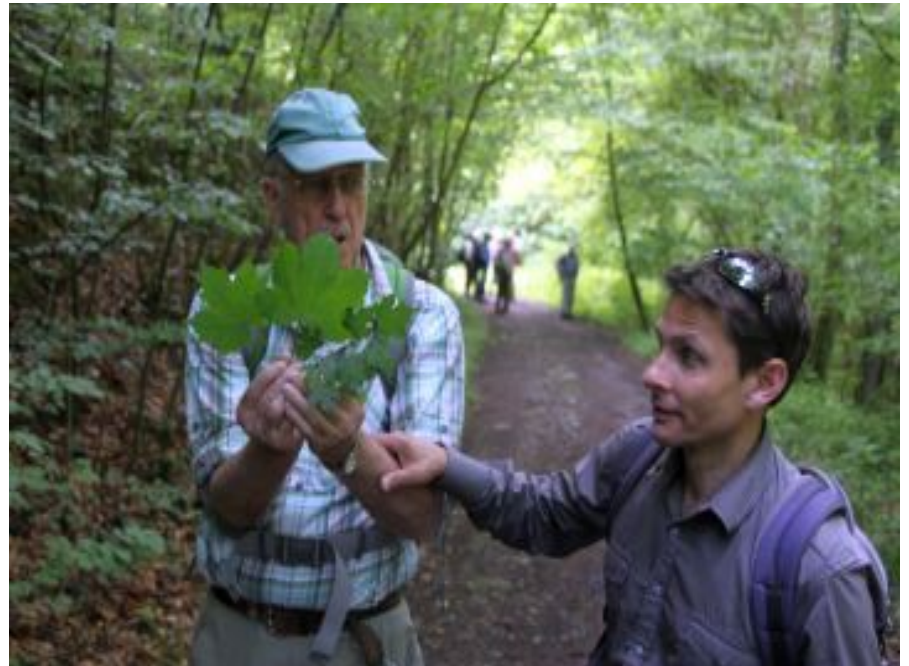
3 Ahorn-Arten: Spitz-, Berg- und Feld-Ahorn

Text, Fotos: Michael Penzel Bilderklärungen: Dieter Büscher