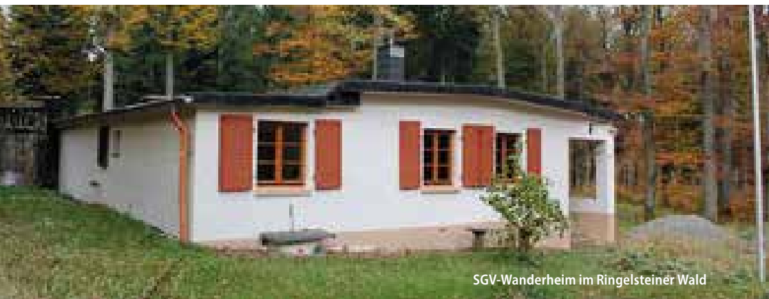
SGV-Wanderheim im Ringelsteiner Wald