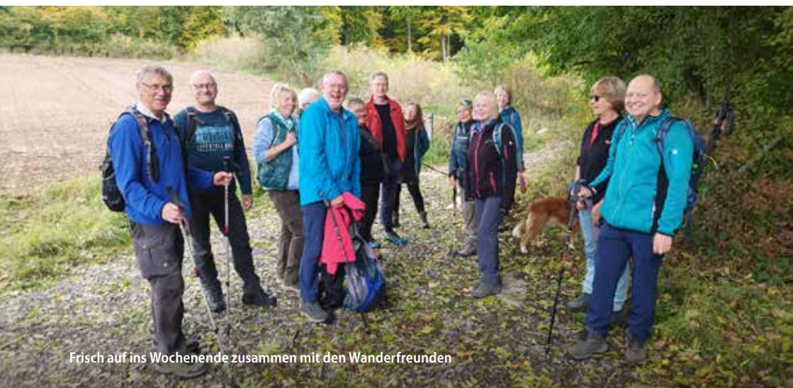
Frisch auf ins Wochenende zusammen mit den Wanderfreunden