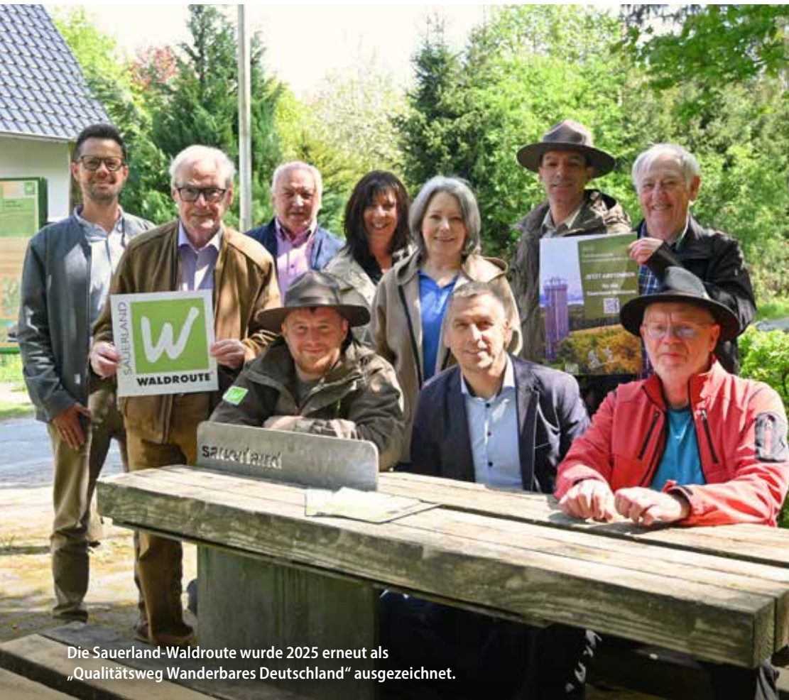
Die Sauerland-Waldroute wurde 2025 erneut als „Qualitätsweg Wanderbares Deutschland“ ausgezeichnet.

Der schönste Wanderweg in Nordrhein-Westfalen ist die Sauerland-Waldroute. Das hat die jährliche Publikumsabstimmung vom Wandermagazin der OutdoorWelten GmbH ergeben, an der sich 46.027 Wanderbegeisterte aus ganz Deutschland beteiligten. Neben dem landesweiten 1. Platz belegte sie auch den Platz 5 in der Kategorie Mehrtagestouren deutschlandweit. Weiterhin wurde die Sauerland-Waldroute erneut mit dem Prädikat „Qualitätsweg Wanderbares Deutschland“ ausgezeichnet und weist somit eine hervorragende Qualität für alle Wanderbegeisterten aus.