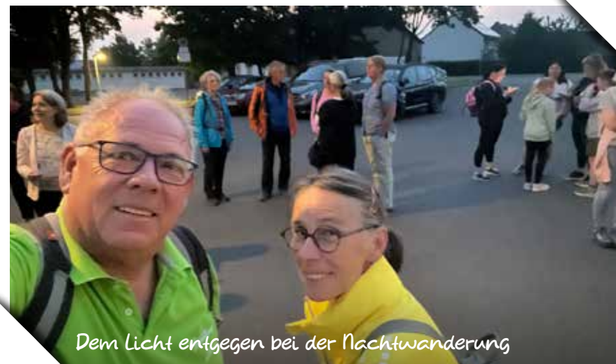
Dem Licht entgegen bei der Nachtwanderung