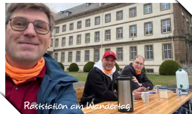
Raststation am Wandertag