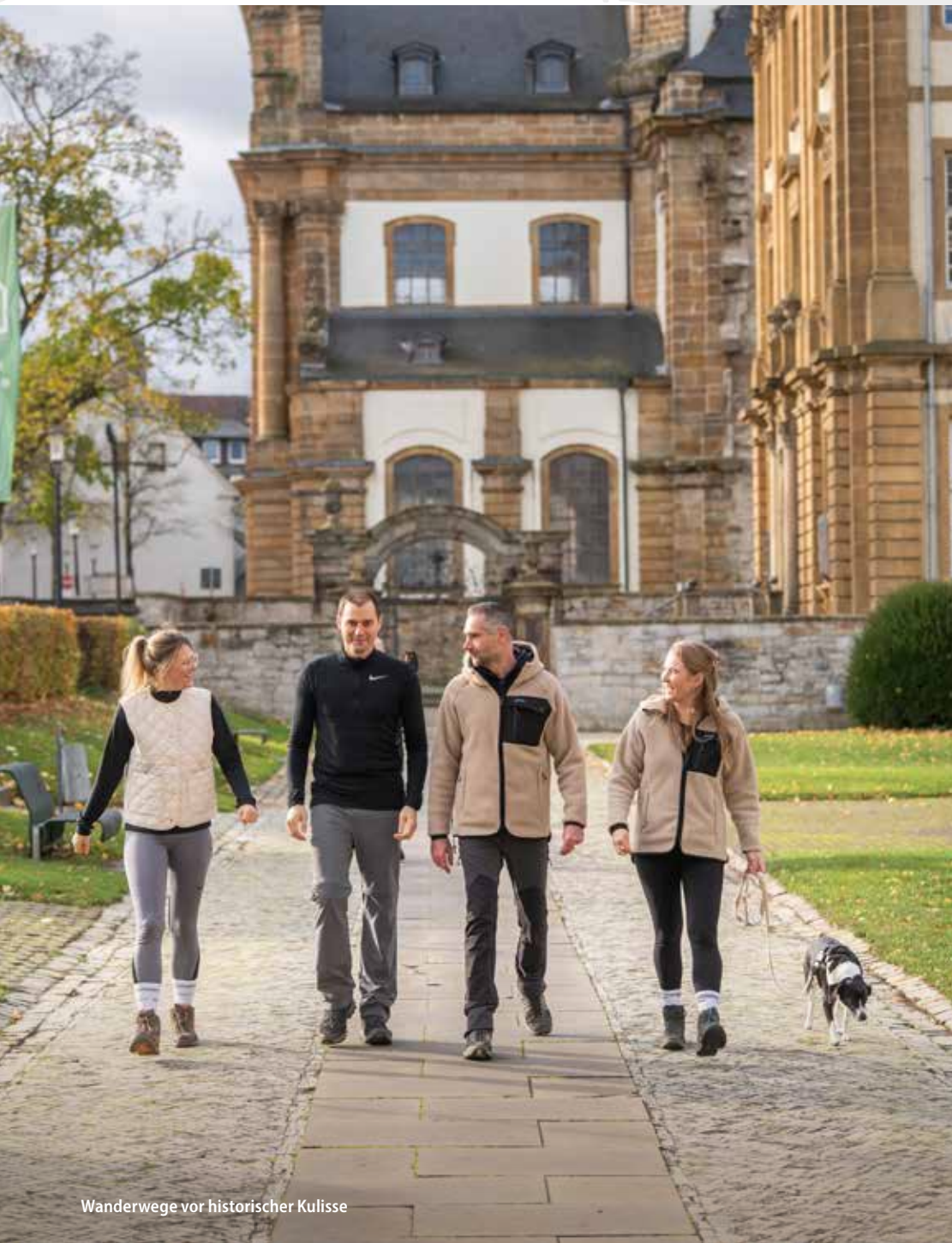
Wanderwege vor historischer Kulisse