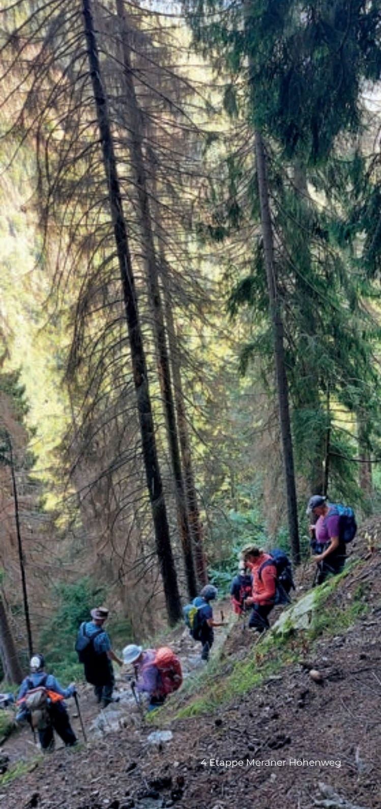
4 Etappe Meraner Höhenweg