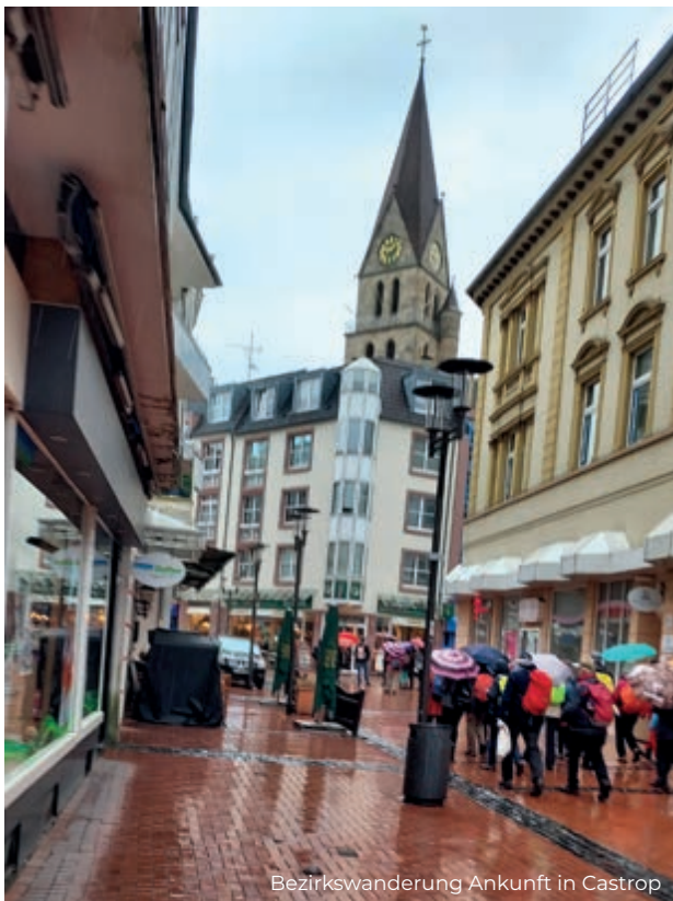
Bezirkswanderung Ankunft in Castrop

13:30 Uhr Ickern Nord (Bushaltestelle), Leveringhauser Straße 91, Einkehr im Cafe Auffenberg am Ickerner Markt, Wf. Wolfgang Finke wolfgang@sgv-castrop-rauxel.de, 02305-31202