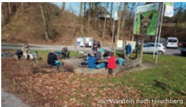
von Warstein nach Hirschberg