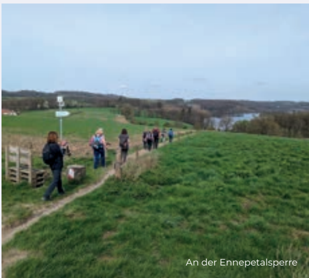
An der Ennepetalsperre

herbert@sgv-castrop-rauxel.de, 0157-74375158