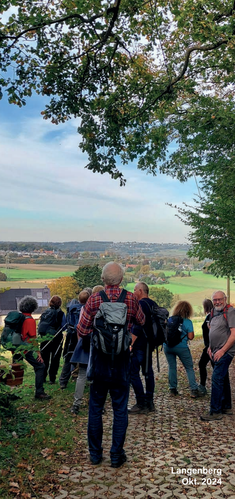
Langenberg Okt. 2024