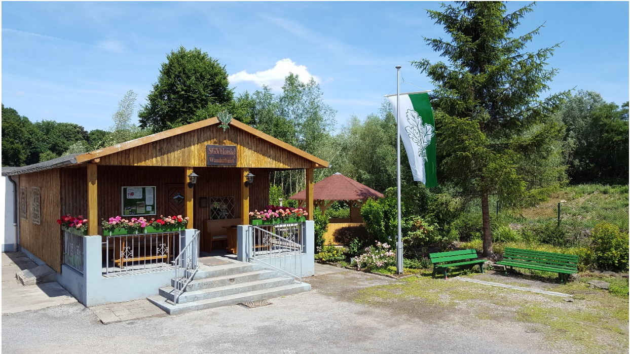
Am Wanderheim: neuer Grillpavillon, Grünanlage verschönert