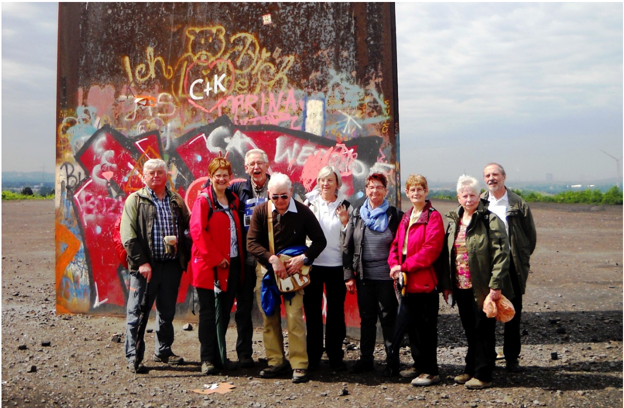
Ruhrgebietswandertag 2018, unsere Gruppe auf der Schurenberghalde