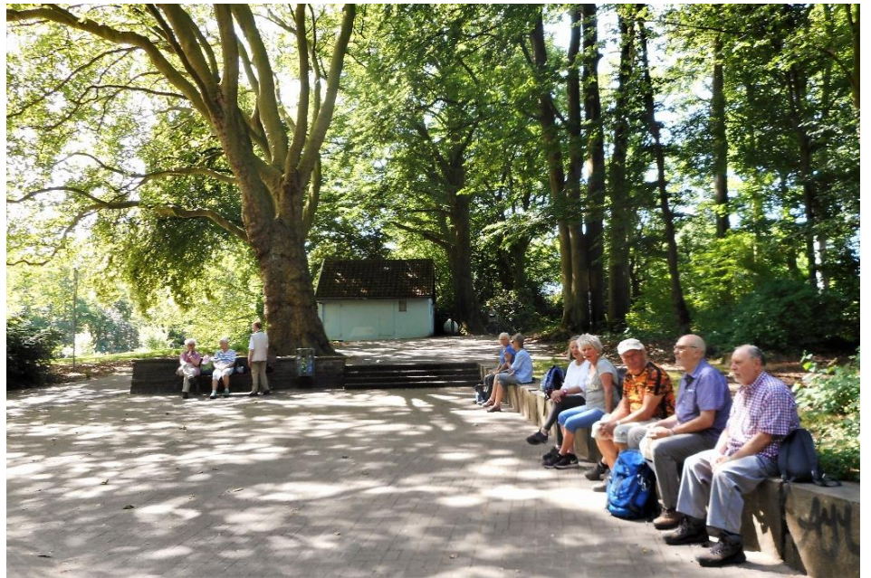
Kurze Rast unter schattigen Platanen im Lütgendort- munder Volkspark