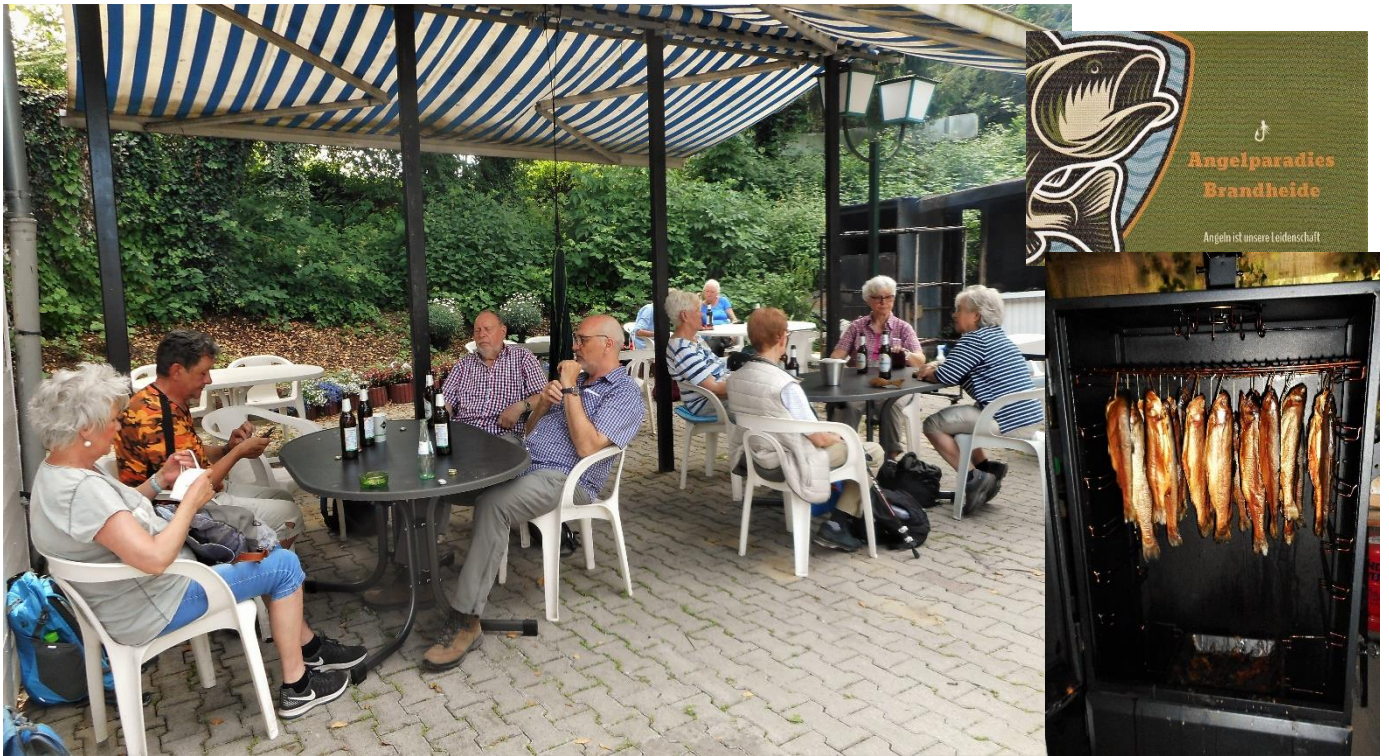
Einkehr im Biergarten des Angelparadieses Brandheide. Frischer geht's nicht. Während wir das erste kühle Bier genießen, sind die Forellen noch im Räucherofen.