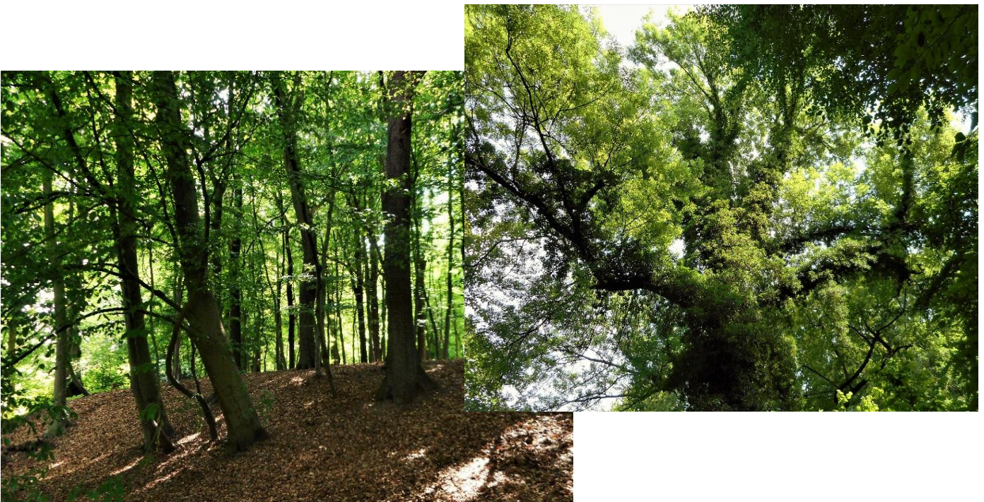
Schattiger Wald im Volksgartern Bövinghausen

Alle Beteiligten waren wohlgelaunt und in bester Stimmung und haben diese erste gemeinsame Wanderung nach der langen Zwangspause als ein ganz besonderes Erlebnis empfunden.