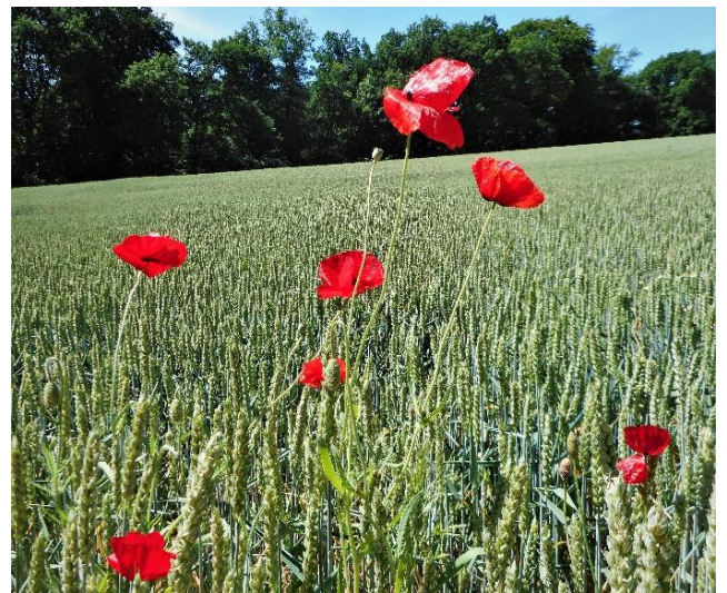
Blühender Klatschmohn am Rande eines Getreidefeldes