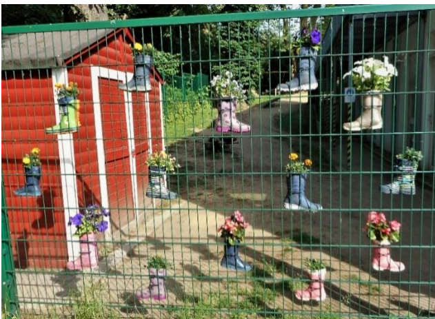
Lustig dekorierter Eingang zu einem Kindergarten