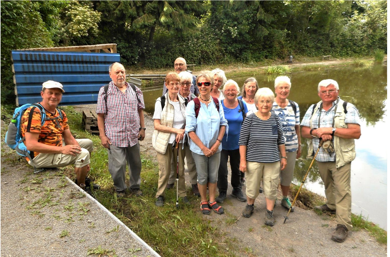
Am Ende der ersten Neustart-Wanderung nach den Corona-Beschränkungen zeigt sich die gesamte Wandergruppe fröhlich und in bester Stimmung.