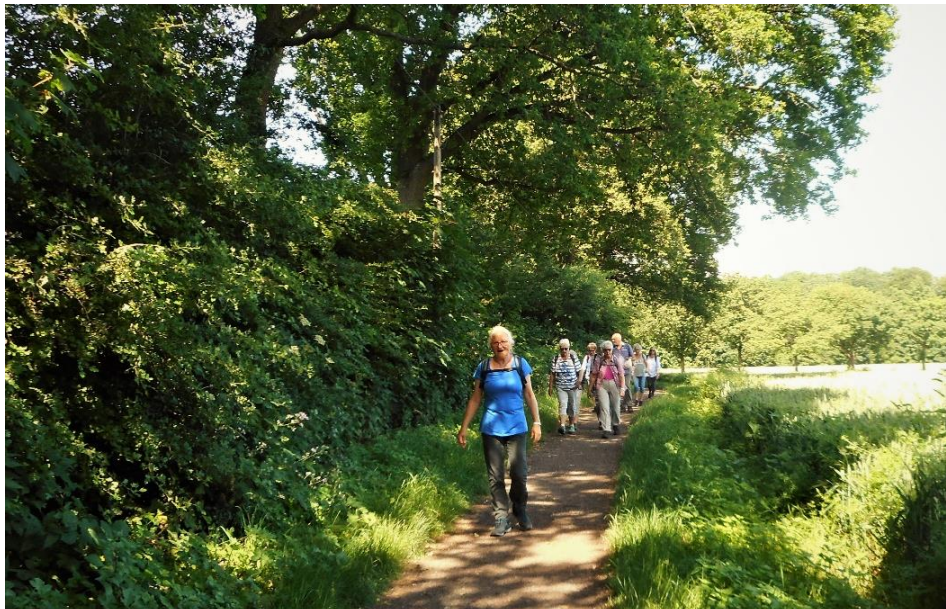
Traumhafte Wanderung bei Bilderbuchwetter in herrlicher Natur