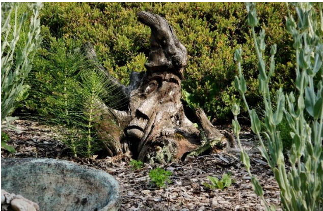
Wurzelnom in einem Garten