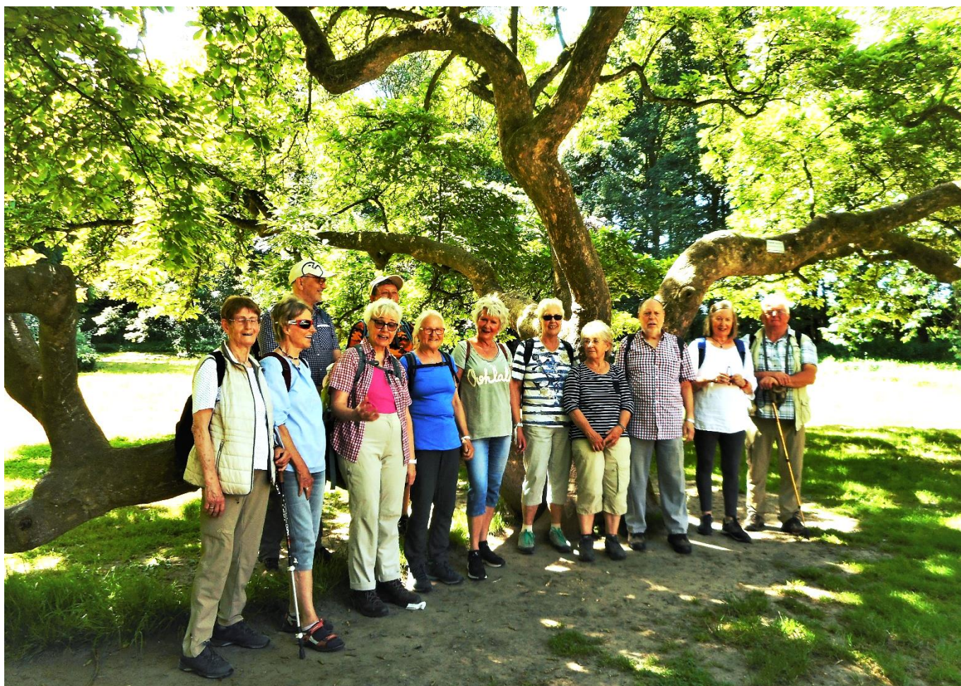
Unsere zwölköpfige Wandergruppe im Park von Schloss Dellwig

Als wir uns an diesem wunderschönen sonnigen Samstagmorgen im Juni nach einer monatelangen, durch die Corona-Pandemie bedingten Zwangspause wieder einmal zu einer Wanderung trafen, war bei allen Teilnehmern sogleich eine besondere Freude, Erleichterung und auch eine Art neuer Optimismus zu verspüren. Auf diese Reaktivierung unserer Wanderaktivitäten hatten alle schon lange gewartet, da im Rahmen der verordneten Corona-Schutzmaßnahmen bis dato selbst Gruppenwanderungen in gesunder frischer Waldluft untersagt waren. Glücklicherweise hatten alle Beteiligten die lange Wartezeit dennoch gesund und gut überstanden.