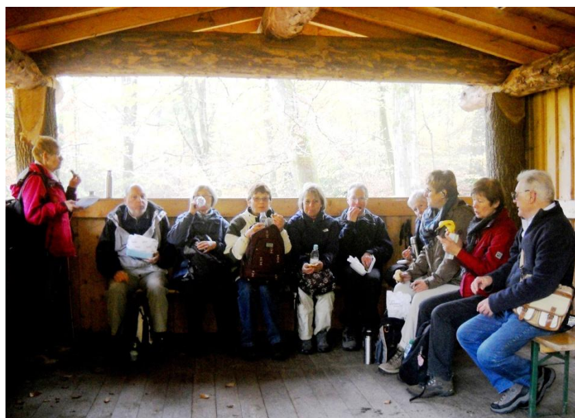
Rast an einer Waldstation