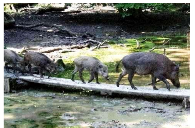
Von überallher macht man sich schleunigst auf zur Futterstelle.