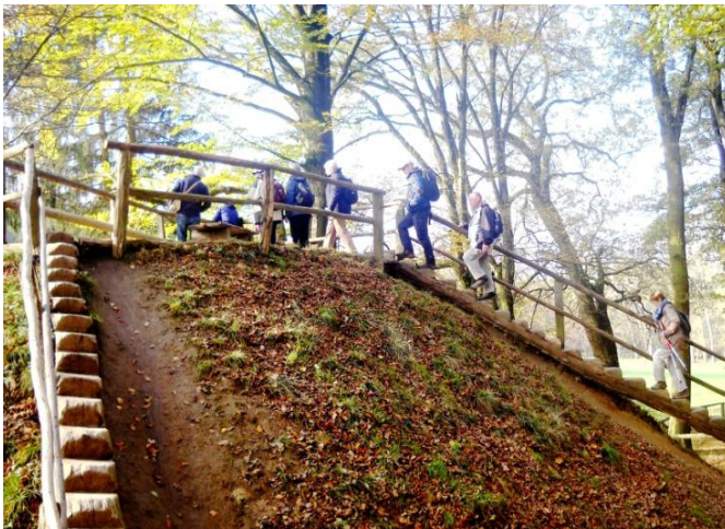
Aufstieg zu einem Beobachtungspunkt im Rotwild-Gehege