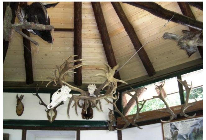
Geweihausstellung in der Waldschule