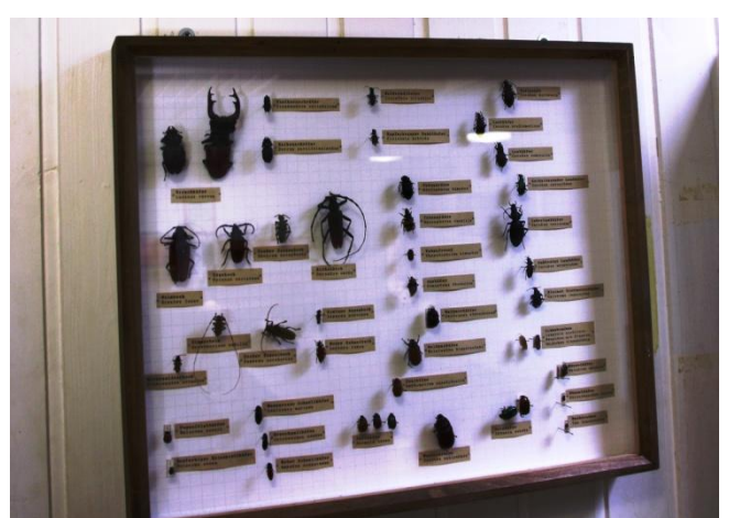
Käfer des Waldes