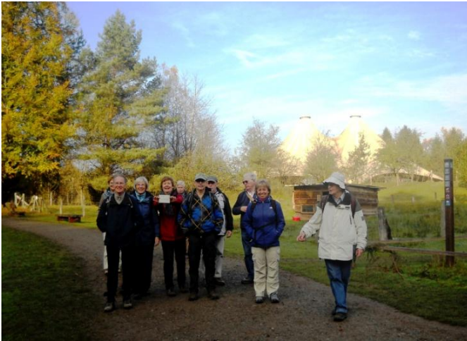
Unsere Wandergruppe beim Start in den Wildwald Vosswinkel