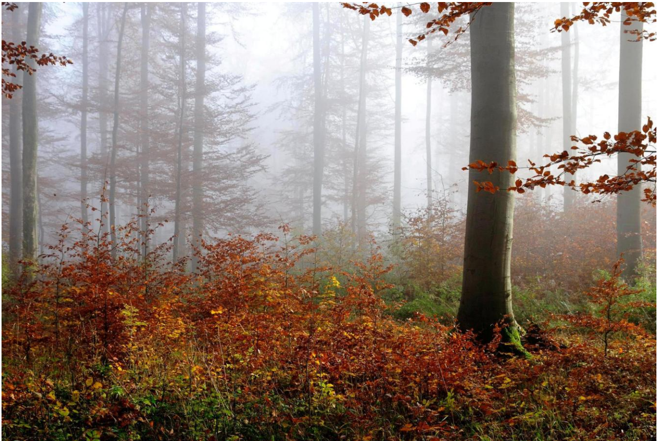
Herbstlicher Laubwald in voller Pracht