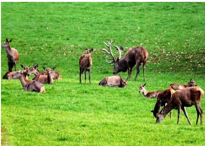
Im Rotwildgehege (2)