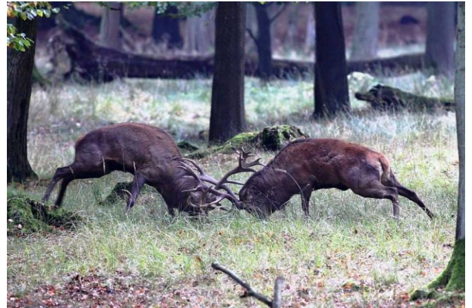
In der Brunftzeit finden im Rotwildgehege immer wieder heftige Rivalenkämpfe statt.