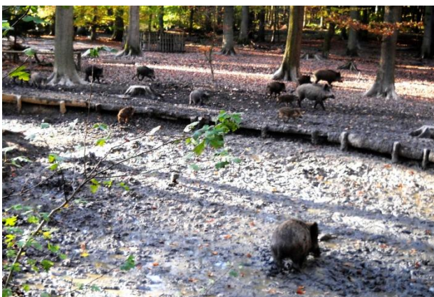
Doch wenig später gerät im Wald alles in Bewegung.