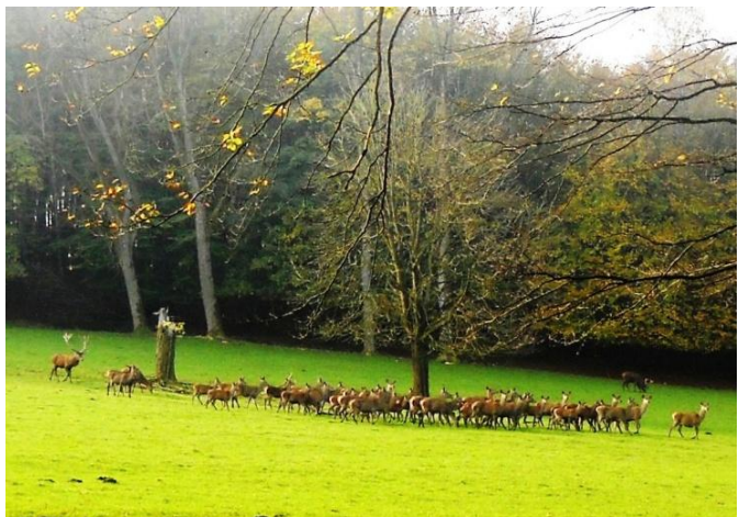
Im Rotwildgehege (3)