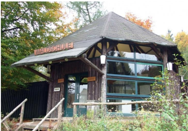
Waldschule im Wildwald Vosswinkel