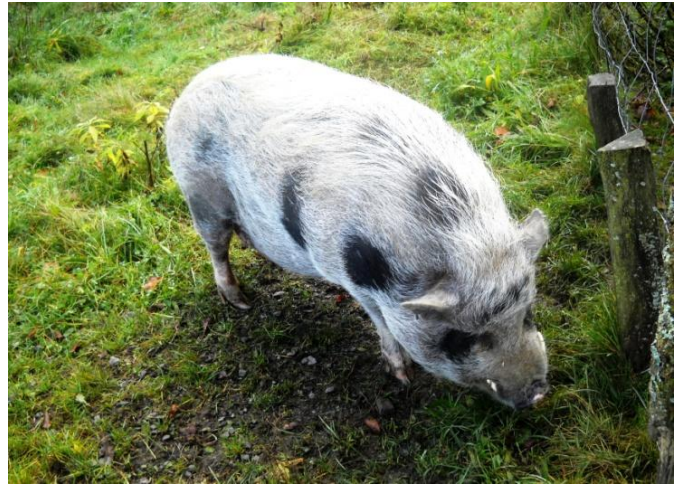
Wir wurden sogleich von diesem zutraulichen Borstentier begrüßt.