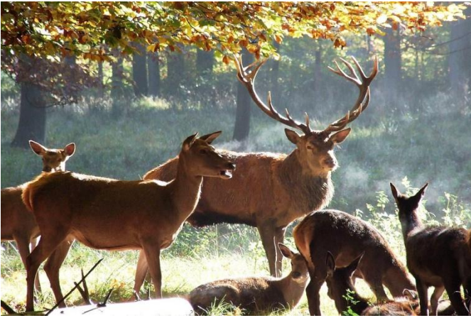
Im Rotwildgehege (4)