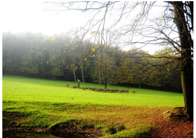
Im Rotwildgehege (1)