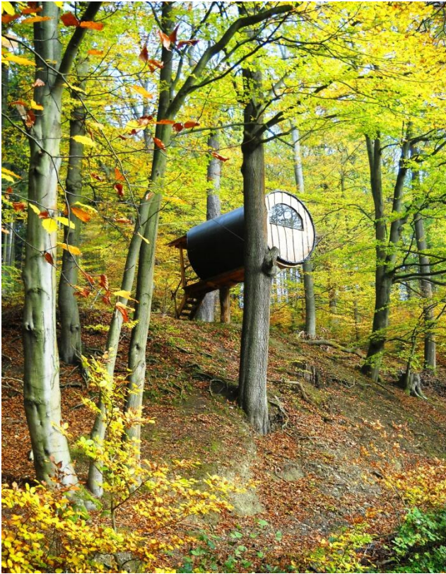
Wer gern einmal im Walde übernachten möchte, kann sich hier einchecken.