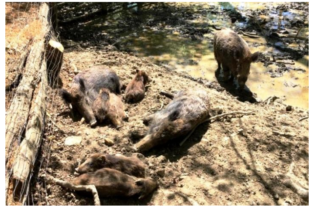
Auch hier genießt man noch einmal die letzten warmen Sonnenstrahlen des Jahres.