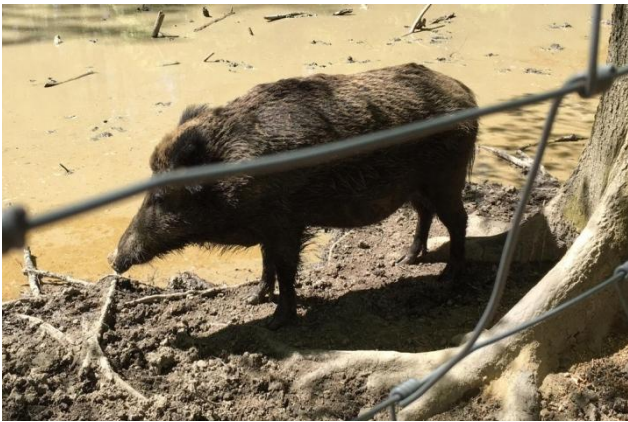
Im Wildschweingehege ist zunächst nicht viel los.