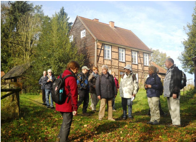
Der im Wildwald gelegene Haarhof, ein historischer Bauernhof wie zu Großvaters Zeiten