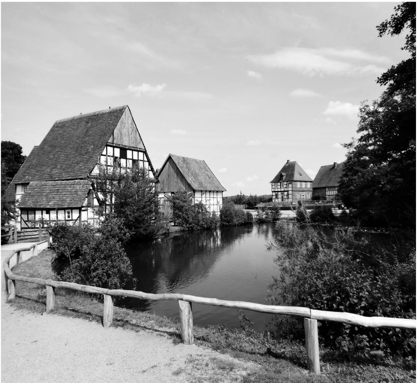
Historisches Bauerndorf im Freilichtmuseum Detmold