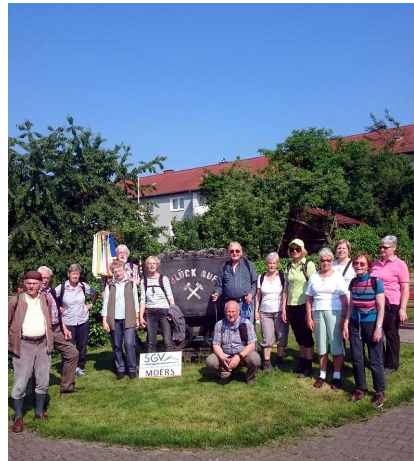
68. Gebirgsfest – Bochum

Internet: www.sgv-moers.de E-Mail: info@sgv-moers.de