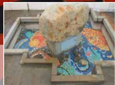
Standort: Vorplatz der Johannis-Kirche, Kirchstr. 18 Künstler: Matthias Holtmann Material: Findling, Fliesen Einweihung: 2014

Das sprudelnde Wasser, das leise Plätschern der abfallenden Tropfen - all dies soll dazu einladen, zu verweilen, sich auszuruhen, zu meditieren.