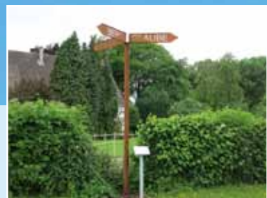
Standort: Hecke Hof Lohmann, Unterdorfstraße 52 Künstler: Mirko Stefan Elfert Material: Cortenstahl Einweihung: 2013

Glaube, Hoffnung und Liebe sind keine Orte, die wir aufsuchen, sie sind die begleitende Kraft auf dem Weg durch unser Leben.