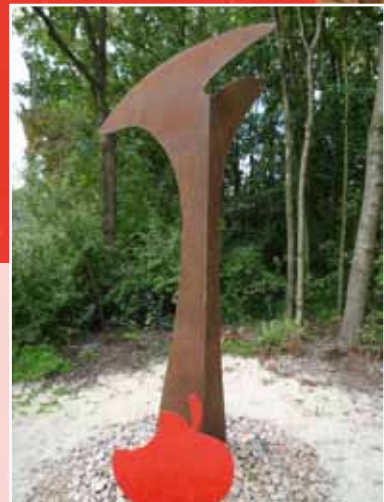
Standort: Zapp Waldstadion Bürenbrucher Weg 180 Künstlerin: Andrea Schütte Material: Baustahl Einweihung: 2010

Ob da die Botschaft Jesu von der Menschenliebe Gottes nicht eine befreiende Alternative ist?!