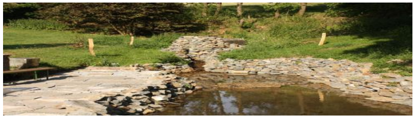
SGV Bild von der Sorpequelle in Wildewiese