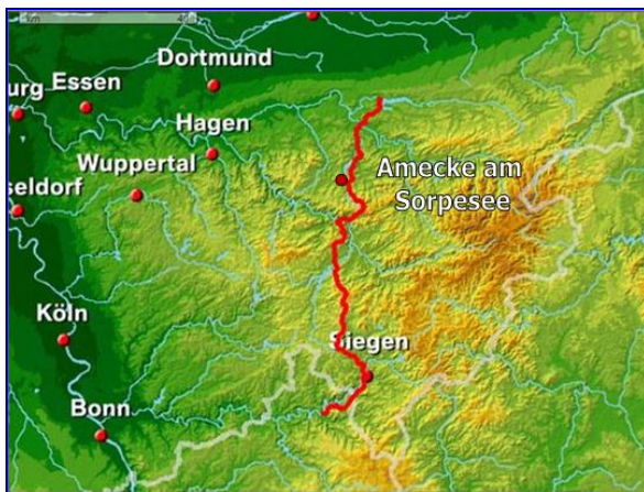
Verlauf Möhne-Westerwald Weg

Der Möhne-Westerwald-Weg ist ein 136 Kilometer langer Wanderweg des Sauerländischen Gebirgsvereins (SGV). Er führt von der Möhnetalsperre über Hüsten, Amecke am Sorpesee, Wildewiese, Attendorn und Siegen nach Betzdorf. Der Wanderweg verläuft durch das zentrale Sauerland bis Betzdorf, dem nördlichen Tor zum Westerwald. Der Wanderweg fällt in die Kategorie der Hauptwanderstrecken des SGV und besitzt wie alle anderen Hauptwanderstrecken als Wegzeichen das weiße Andreaskreuz X , an Kreuzungspunkten erweitert um die Zahl 24=X 24 . Der Wanderweg führt überwiegend über Schotter- und Waldwege, nur wenig asphaltiert.